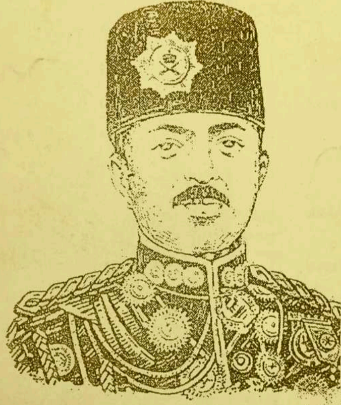
غازي امان الله خان