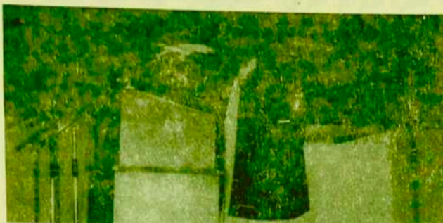
ډاکټر کبير ستوری: