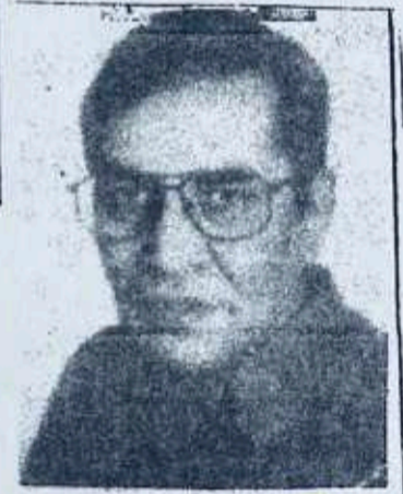
ډاکټر کير ستورې

د پښتو ډیریوال کانفرنس او قاسی جرگې ته ښانه شوه چې ستانه متحد کیدي شي قاسی جرگه زموږ ائمانه ده، موږ خپلې لانجې او رېرې په جرگو هواروو باند افغانستان داسې نظام بحکم شي چې هرچا ته د خپل شخصیت دودې پراخې بونمي بد لاس ورسې