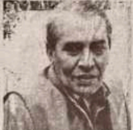
پښتو او پښتونولي په خم کښې رنگ او په اصطلاح د شاعري ټول ناروېدونکي پښتني دي. دده د شاعري بيله ځانگړنه رواني او سلاست دى، تعقيب، ابهام، او پېچلي کلمات او الفاظ نه لري. ساده او روان لفظي انځورونه جوړوي. د افغادي ژبه يې فصيحو ده يې خايه نه وي کله ووايو هغه څوک چې څه ناڅه سواد ولري، دده د اشعارو په مضمون او محتوا پوهيدى شي.