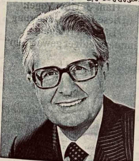
هانس یوخن فوگل ( Hans Jochen Vogel )

لوتولیز لوبو وسایل تر کارې لولو ته حاجت نشته دی او خفصرسی ملکیت د خفصرسی حق لاری خوجه د لوتولیز عدالت په منځه کې خنډ نه وی . دی هر دود د لوتولیز لوبو لوبولیز حالت رسوشیالیزم او اولوتولیزې ( دیموکراټیکې ) لارې د لوتولیزې رسوشیالیزم لوتولیز خنډه کوی چه هر څوک پکې په ازادانه توگه خپل رسوشیالیزم ته وده ورکوی او دانشانانو په خدمت کې د لوتولیز په سیاسي اقتدای او کلتوری شونډ کې برخه اخلی .