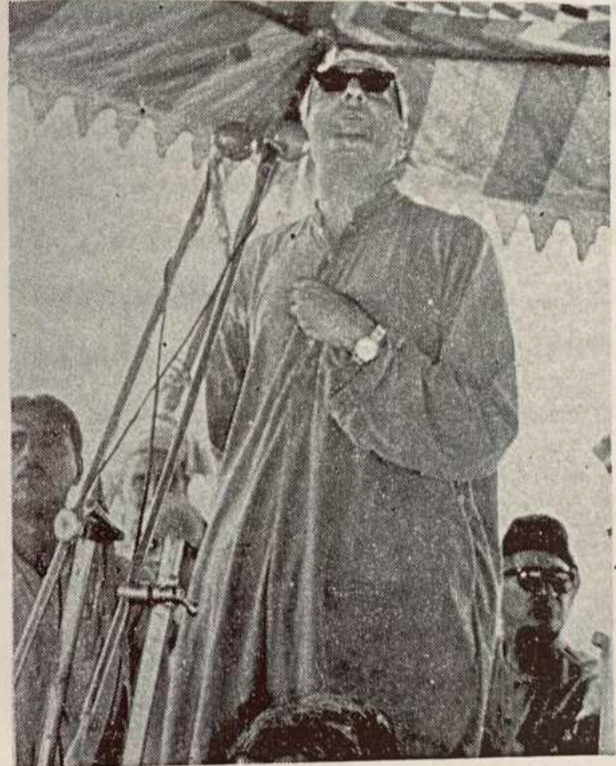
ستر مشر ولى خان

دادنه کتاب نوم دی په دپنټنو ستر مشر ولى ټاکنې او په ۱۹۸۷م عيسوي کال کې دکابل په دولتي مطبعه کې چاپ شوی دی . په دغه کتاب کې