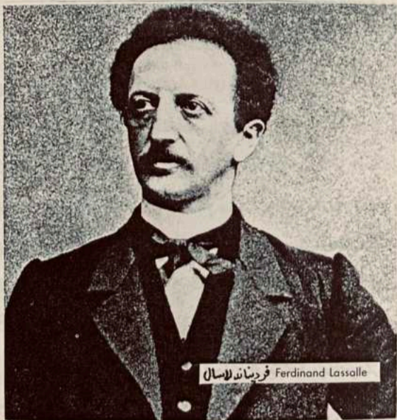
Ferdinand Lassalle فریدماند لاسال

په دغه ورځ په لایپزیک (Leipzig) کبی فر دینامند لاسال - (Ferdinand Lassalle) د جیون دکارگر و ستر شری لیزه کته (Allgemeinen Deutschen Arbeiterverein - ADAV) موخا کیه خولاسال (Lassalle) غونښتلی چه کارگر پر لیزه خمانه گوند کتی تر لوتلشی ترخی چه د ستر شری ټاکلی د حق او پیدای واری انی لیرالی لپاره ملی خلک وکی ی .