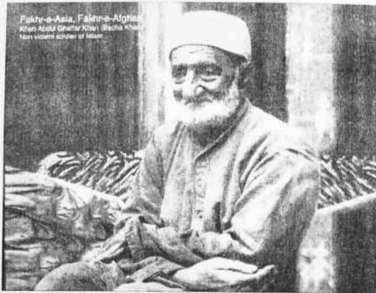
که سپوره وي، که پوره په شريکه به وي. (باچا خان)

پښتانه په سيمه کې يو ستر ځواک دی، سيمي ته ثبات او امينت بخښي، پغیر د پښتنو د قامي وحدت، سولې او ارامۍ څخه په دغه سيمه کې امن او سوکالي نه شي راتللی نو د پښتنو ټولنيز ولسو گوند د نړۍ د سوله غوښتونکو او ډيموکراتيکو هيوادونو او ځواکونو څخه په کلکه غوښتنه کوي چې د پښتنو په بيا يووالي کې مرسته وکړي. د پښتنو يووالي په سيمه کې د امن او ثبات ځامن دی.