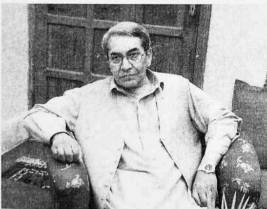
د هدف لپارې لارې لټوي، خو د لارې لپاره هدف مه بدلوي.

Das brot, ob belegt oder trocken, wird unter allen gemeinsam aufgeteilt. (Batscha Chan) Buttered or unbuttered bread will be common. (Bacha Khan)