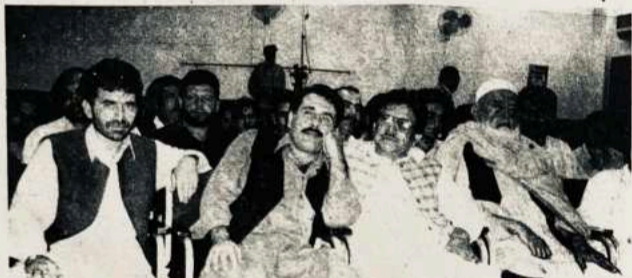
نړېوال پښتو کانگرس د غونډې څنډه - پېښور

دا خبرې تر ډېره وخته پورې جارې وې، چې هره خبره يې د سند وه. د اکوړه خټک نه د راتلو نه پس سباله