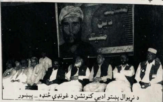
د نړېوال پښتو ادبي کنونشن د غونډې څنډه - پېښور

ليک او لوست په مورنۍ ژبه ضروري دی. په جرمني کې پښتو ژبه په ښوونځيو (سکولونو) کې رسمي ژبه ده.