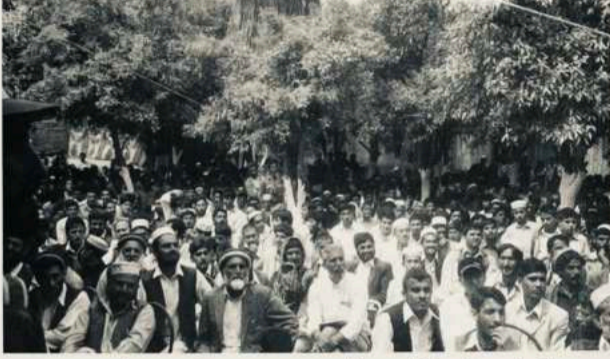
د ننگرهار د نارنج گل د مشاعرې د غونډې څنډه - ننگرهار ۱۳۸۰/۴/۸

که سپوره وي، که پوره په شريکه به وي. (باچا خان)