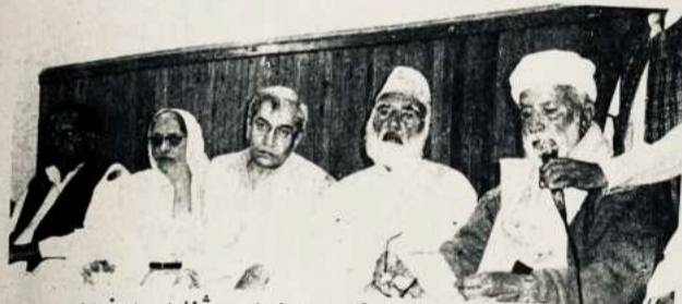
د ډيورنډ لاین د کتاب د مخکتنې د غونډې څنډه - پېښور

پښتو ژبې د لوی ليکوال او سياسي مبارز ښاغلي اجمل خټک پوښتنې ته ورغلو. په دې موقع د ستوري