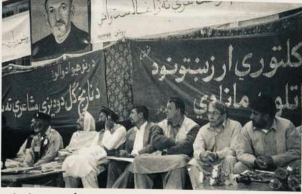
د ننگرهار د نارنج گل د مشاعرې د غونډې څنډه - ننگرهار ۱۳۸۰/۴/۸