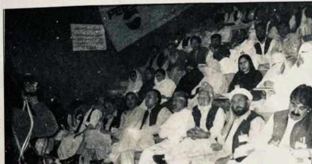
د نړيوال پښتو ادبي كنونشن د غونډې څنډه - پېښور

دپاره په حكومتي سويه څه كار نه دی شوی. په اولسي سويه چې كوم كار ورته شوی هغه هم پوره نه دی، نو د پښتو ژبې د عربي ليكدود بشپړول ضروري دي.