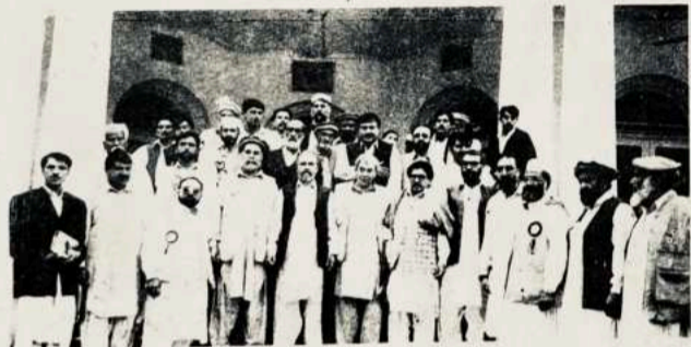
د نړېوال پښتو ادبي کنونشن د غونډې څنډه - کوهاب