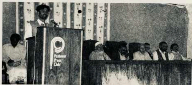
نړېوال پښتو کانگرس د غونډې څنډه - پېښور

يعنې په ۲۴ مارچ ښاغلي کبير ستوري دا فيصله وکړه، چې د رنځور ولي خان پوښتنې له خامخا ورځي، ځکه چې خان عبدالولي خان د حضرت باچا خان د سترگو تور او د ټولو پښتنو د زړه ټکور دی. په