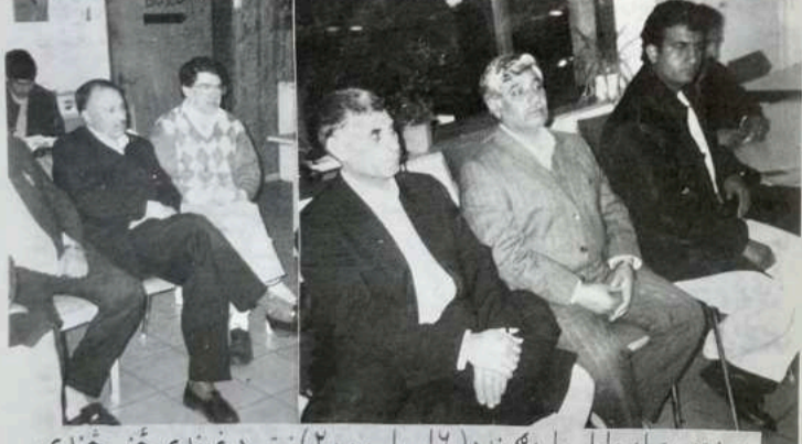
دپښتنو ډولنيوز اولسوليز گوند (٦ اپريل ٢٠٠٠) نيتي د غونډې ځني ځنډي